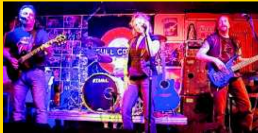
FULL CIRCLE – Rock, Soul & Blues

Sozusagen ein Klassiker in der Rock Legende: Full Circle bringt seinen Mix aus über 50 Jahren Rock, Soul und Blues, abwechslungsreich und tanzbar. nob