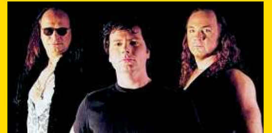
ROCKHOUSE – Rock Covers