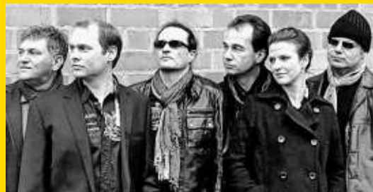
LAZY MONKEYS – Rock Covers